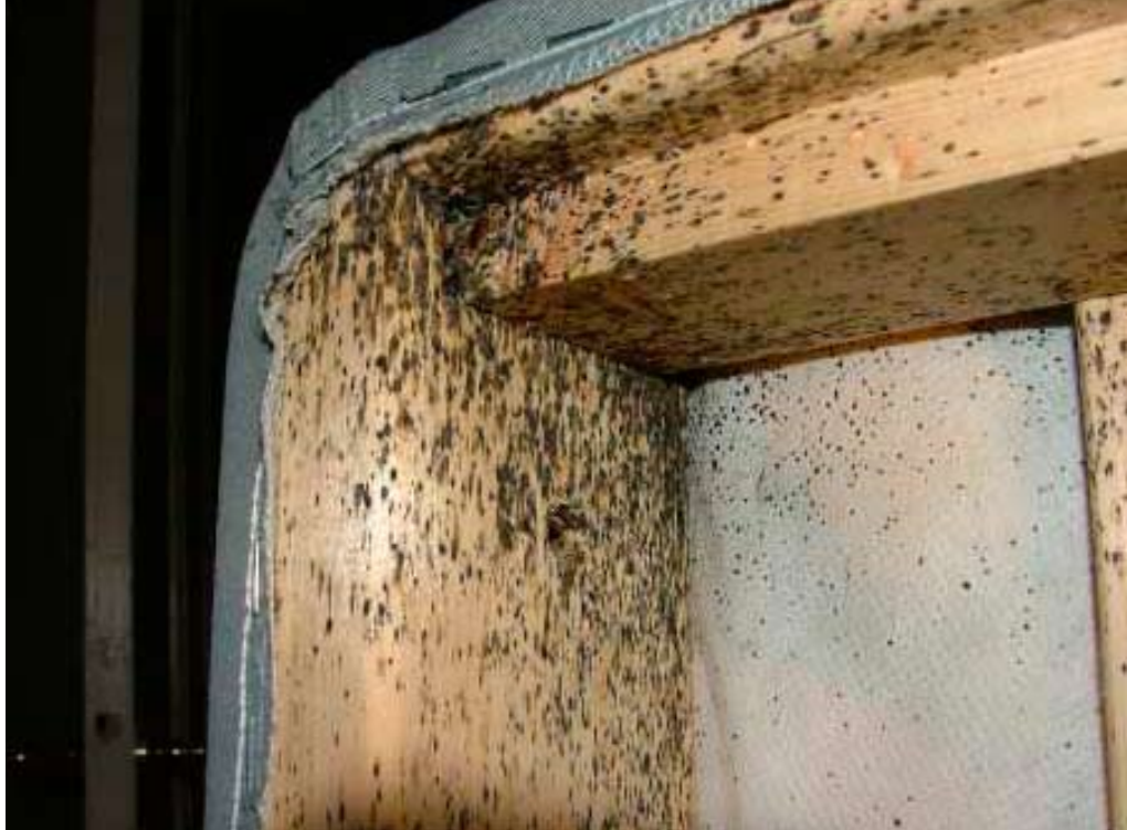
Figur 3: Tydelige tegn på væggelus i en sengebund.

Et andet sundhedsmæssigt aspekt er selve effekten af væggelusens bid. I forbindelse med biddet overfører væggelusen spyt til værten, og dette spyt indeholder proteiner, der kan føre til udvikling af allergiske reaktioner hos nogle patienter. Biddet i sig selv mærkes ikke, men efterfølgende kan der i flere dage opleves stærk kløe. Det er ikke muligt sikkert at identificere et væggelusebid i forhold til bid fra andre blodsugende insekter, men der er grund til mistanke om væggelus, hvis biddene er placeret på de dele af kroppen, der er frit eksponerede, når man sover - væggelusen kravler ikke ind under dynen. Lopper derimod vil meget gerne bide på steder, hvor de kan komme til at sidde under lidt stramt tøj - gerne under en elastik i taljen, ved anklerne under strømperne, eller under dynen etc. Sådanne steder kan der være mange bid samlet. Myg stikker på de samme eksponerede steder som væggelusene, men hvor væggelusebid gerne sidder flere sammen, vil myggestik ofte være placeret tilfældigt på kroppen.