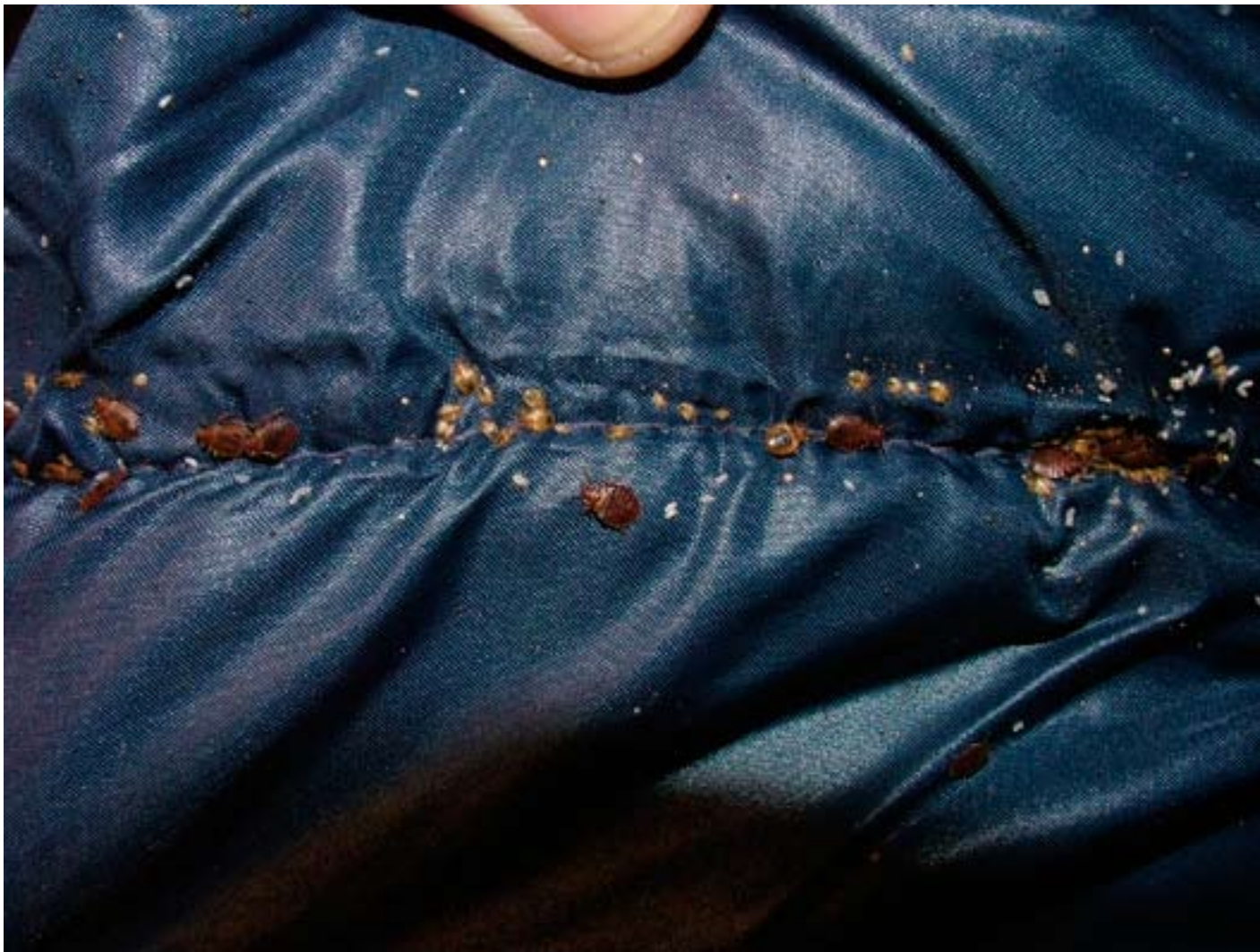
Figur 5: Sovepose der var gemt under en seng. Her har flere tusind væggelus slået sig ned.