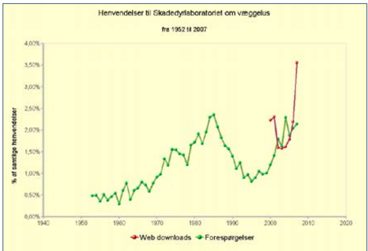
Figur 1: Procent af henvendelser til Skadedyrlaboratoriet der vedrører væggelus i årene 1952 til 2007.

gelus, viser den en støt stigning gennem de senere år (Figur 1). Det er den generelle opfattelse, at det forløb, der ses i figuren, i høj grad afspejler udviklingen i brugen af insektmidler efter anden verdenskrig, hvor brugen af DDT og andre chlorerede forbindelser gav en meget effektiv bekæmpelse af væggelus i halvtredserne og tresserne. Disse midler blev gradvist faset ud af markedet i halvfjerdsere, og i begyndelsen af firserne var de endegyldigt væk. Udviklingen i denne periode blev sandsynligvis også påvirket af en anden vigtig faktor, nemlig en stærkt stigende rejseaktivitet, som gav en øget risiko for at bringe væggelus med hjem fra destinationer i Sydeuropa, hvor forekomsten formodentlig var højere. Til erstatning for DDT og lignende bekæmpelsesmidler tog de meget effektive persistente, syntetiske pyrethroider og mikroindkapslet chlorpyrifos over, og fra midten af firserne og til midten af halvfemserne holdt disse meget effektive midler antageligt væggelusene i skak. Det blev afspejlet i et fald i