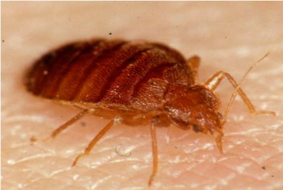
Figur 2: Voksen væggelus på udkik efter mad.

frekvensen af henvendelser til Skadedyrlaboratoriet om væggelus i denne periode, men siden årtusindskiftet er frekvensen af henvendelser om væggelus igen taget til.