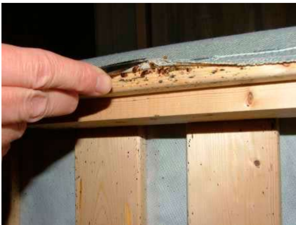
Figur 4: Væggelus under betrækket på en sengebund.

Ud over de rent fysiske følger hos patienterne ses hos nogle også en meget stærk psykisk reaktion. Væggelus var tidligere stærkt socialt stigmatiserende, og for mange er de det givetvis endnu. Samtidig opfattes de af mange som "ækle", men her må man lægge vægt på, at der trods alt ikke er nogen større smitterisiko ved væggelusenes tilstedeværelse. Derudover er